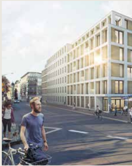
Mitten in der Innenstadt: Die Baywobau investiert in Halle (Saale).