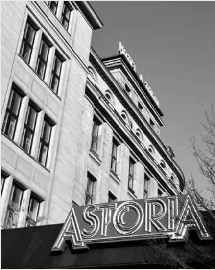
Kult um Gebäude: Das Astoria in Leipzig wird revitalisiert.