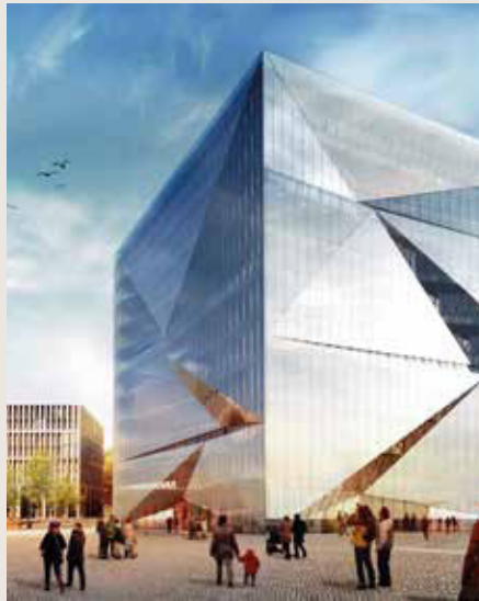
Wo die meisten Kräne stehen: Die Europacity wächst immer weiter.