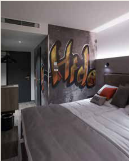
Auf dem Parkhausdach: Die MQ Real Estate baut ein Hotel.