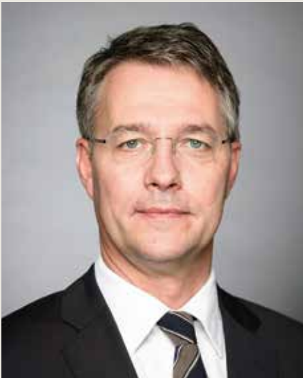
Willkommenskultur für Neubauten: Gunther Adler, Staatssekretär im Bundesinnenministerium, im Interview