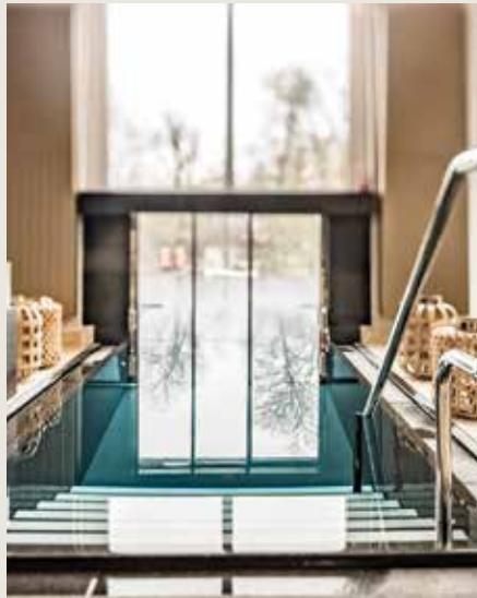
Willst Du Meer? Ferienimmobilien werden immer beliebter.